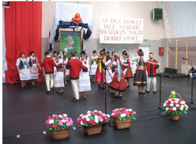
Występ zespołu folklorystycznego „Jegodecki” z Zalasa.