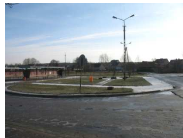
Pozyskanie środków zewnętrznych pozwoli znacząco poprawić wygląd Dworca.

- Zagospodarowanie terenu przy dworcu PKS w miejscowości Łyse, polegające na kompleksowej przebudowie obiektu. W planach inwestycji znajduje się budowa nowej wiaty przystankowej, remonty chodników, utworzenie placu zabaw dla dzieci oraz skwerku z ławeczkami i oświetleniem. Koszt tej inwestycji oszacowany został na blisko 1 mln zł. Połowa poniesionych kosztów będzie zwrócona w ramach programu „Odnowa i rozwój wsi”.