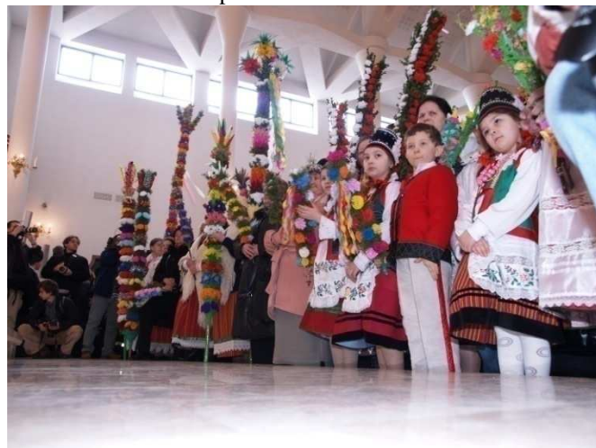
Bardzo cieszy widok coraz większej liczby dzieci ubranych w stroje kurpiowskie

Wszystkie pozostałe palmy zakwalifikowane do konkursu zostały wyróżnione nagrodą pocieszenia w wysokości 100 zł. Komisja konkursowa w sporządzonym protokole podkreśliła wysoki poziom artystyczny, oraz rekordową liczbę ocenianych palm. Pojawił się również wniosek o zwiększenie środków finansowych na nagrody w ramach kolejnych konkursów Palma Kurpiowska.