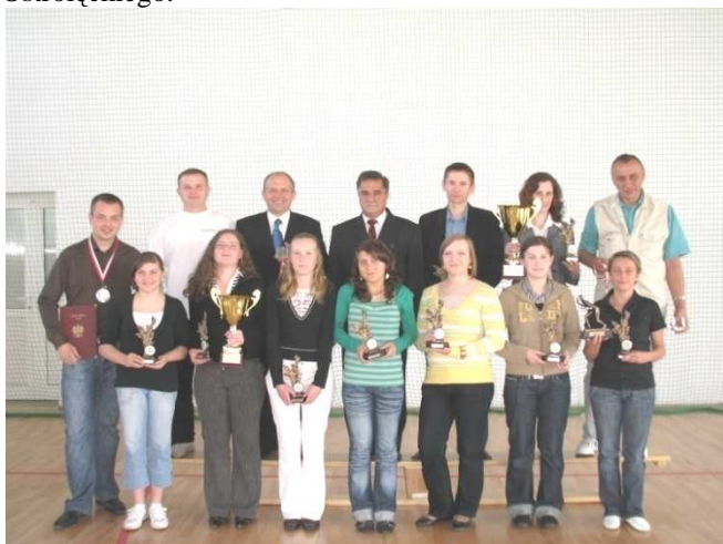
Podsumowanie rozgrywek ligowych tenisa stołowego w sezonie 2008/2009.