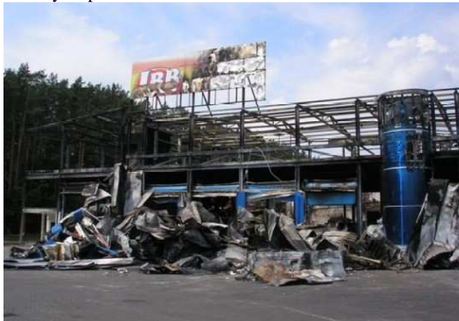
Zakład przetwórstwa mięsnego JBB kilka dni po pożarze.

Gdy 29 czerwca 2009 r. w Zakładzie Przetwórstwa Mięsnego JBB w Łysych wybuchł pożar nikt nie wyobrażał sobie jak olbrzymie będą straty. Po kilku godzinach walki z żywiołem było już wiadomo, że hali produkcyjnej nie da się uratować. Najgorszym skutkiem tego wydarzenia jest niewątpliwie utrata pracy przez blisko 1,5 tys. osób. Tragedia ta dotknęła pośrednio również inne firmy, które borykają się ze znacznym spadkiem dochodów.