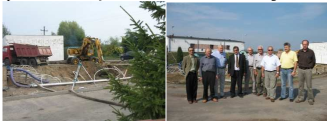
Kilka dni po rozpoczęciu budowy.

Koszt całego przedsięwzięcia określono na ponad 7,5 mln zł. Modernizację oczyszczalni oraz budowę kanalizacji sanitarnej przeprowadzi konsorcjum firm „SANPROD” Sp. z o.o. z Ostrołęki oraz PPU „DALBA” z Białegostoku.