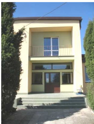
Wejście do Szkoły Podstawowej w Szafrankach 2.09.2009r.

W lipcu 2009 gmina Łyse rozstrzygnęła przetarg na inwestycję pod nazwą: „Zaprojektowanie i wykonanie termomodernizacji obiektów użyteczności publicznej w Gminie Łyse”. Operacja ta dotyczy prac termomodernizacyjnych w 5-ciu obiektach użyteczności publicznej na terenie naszej gminy tj. budynku UG w Łysych oraz budynków Szkół Podstawowych w Warmiaku, Wejdzie, Szafrankach i Dębach. Po niespełna dwóch miesiącach widać już pierwsze efekty prac. Na początek wyremontowane zostały szkoły podstawowe w Dębach oraz Szafrankach. Przeprowadzone prace polegały na kompleksowej wymianie urządzeń instalacji CO. Wykonane zostało również zewnętrzne ocieplenie budynków. Nowa elewacja zdecydowanie poprawi estetykę szkół, dzięki czemu będą wyglądały one czysto i schludnie. Dzięki tym pracom z pewnością uda się zaoszczędzić spore kwoty na ogrzewaniu budynków więc inwestycja powinna stosunkowo szybko się zwrócić.