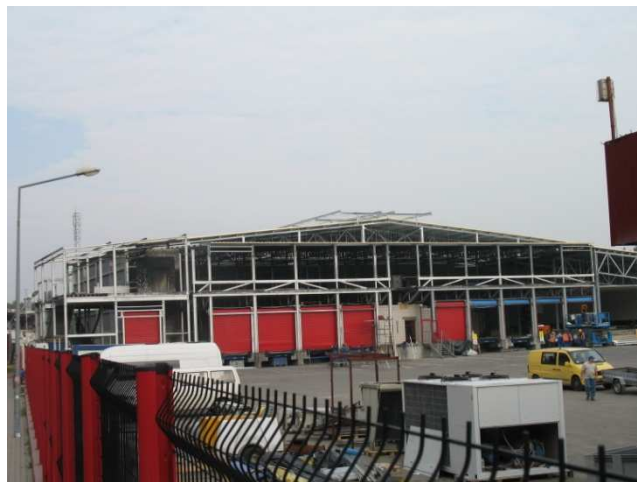
15.09.2009 r. – Główne elementy nowej hali produkcyjnej są już gotowe.

nie zaplanowanych inwestycji. Liczymy, że w tych trudnych dla nas czasach uda się wykorzystać wszystkie nasze atuty.