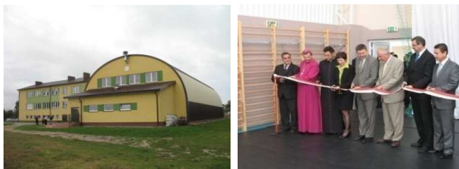
Nowa sala gimnastyczna przy ZS w Zalasiu

25 Września 2009 r. odbyła się uroczystość otwarcia nowej sali gimnastycznej przy Zespole Szkół w Zalasiu. Ceremonia rozpoczęła się mszą świętą w kościele p.w. św. Stanisława Kostki w Zalasiu.