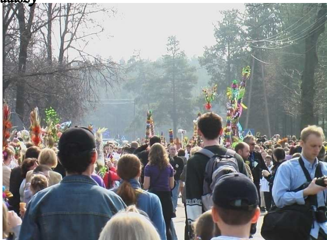
Przygotowania do procesji podczas Niedzieli Palmowej 2009 r.

Nadszedł czas na podsumowanie jubileuszowej Niedzieli Palmowej 2009 oraz XL konkursu na najpiękniejszą palmę kurpiowską. W tym roku swoją obecnością zaszczycała nas rekordowa liczba uczestników. Wymarzona do zwiedzania pogoda i piękne, kurpiowskie palmy ściągnęły do nas gości z całego kraju jak i z zagranicy. Obok rekordu odwiedzających padł również rekord ilości zgłoszonych do konkursu palm - w tym roku było ich aż 235.