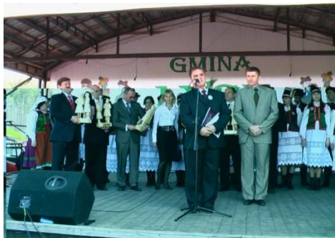
Wręczenie statuetek dla zasłużonych dla kultury kurpiowskiej