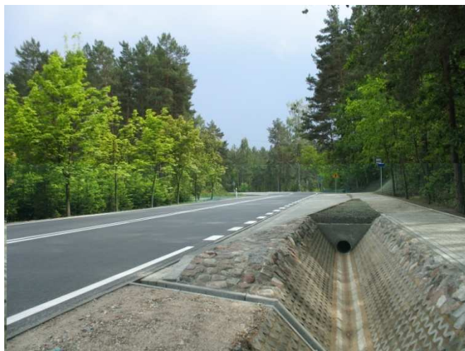
Fragment wyremontowanego odcinka w pobliżu leśniczówki w Serafinie.

pozytywnie zaskoczony jakością wykonanych prac. Jeszcze w czerwcu 2009 ogłoszony zostanie przetarg na kolejny odcinek drogi w stronę Łysych. Zdaniem Wójta Gminy, wykonany odcinek drogi pozytywnie świadczy o wykonawcy i pozwala spojrzeć z optymizmem na dalszą część inwestycji. Przypominamy, że do końca 2010 roku podobna nawierzchnia ma być położona na pozostałej części drogi wojewódzkiej nr 645 od miejscowości Serafin aż do mostu na rzece Szkwie. Cieszymy się, że w naszej gminie coraz szybciej przybywa dróg o tak dobrej nawierzchni. Zleceniodawcą inwestycji jest Mazowiecki Zarząd Dróg Wojewódzkich w Warszawie. Remont drogi wojewódzkiej jest jednak możliwy tylko dzięki temu, że nasza gmina sfinansowała opracowanie dokumentacji technicznej za ponad 180 tys zł.