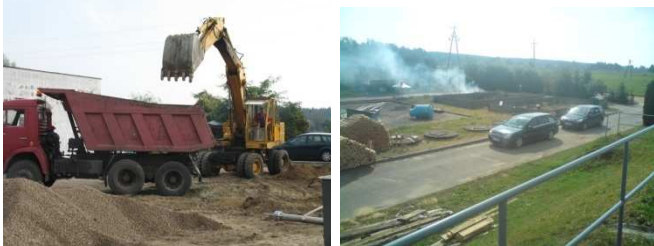
Przygotowania do budowy nowej oczyszczalni ścieków.

W ramach działań zmierzających do uregulowania gospodarki wodno-ściekowej na terenie gminy Łyse do końca października 2010 r. zostanie zrealizowany projekt „Poprawa gospodarki ściekowej w Gminie Łyse poprzez rozbudowę oczyszczalni ścieków oraz budowę kanalizacji sanitarnej, ciśnieniowej z przyłączami w miejscowości Łyse”. Na realizację tego zadania gmina otrzymała środki z Regionalnego Programu Operacyjnego Województwa Mazowieckiego na lata 2007-2013. Przedsięwzięcie obejmuje wykonanie mechaniczno-biologicznej oczyszczalni ścieków. W ramach inwestycji zostanie wykonana instalacja mechanicznego oczyszczania ścieków składająca się z sito piaskownika, automatycznej stacji zlewnej ścieków z pomiarem i identyfikacją dostawców umieszczoną w kontenerze, a także pompownią ścieków własnych i dowożonych. Przedsięwzięcie obejmuje także budowę pompowni osadów, dwóch reaktorów biologicznych z osadnikami wtórnymi oraz budynku odwadniania osadów, w którym zostanie zamontowana instalacja odwadniania osadów nadmiernych wraz z prasą taśmową. Przepustowość nowej oczyszczalni wynosi docelowo 360 m 3 /d.