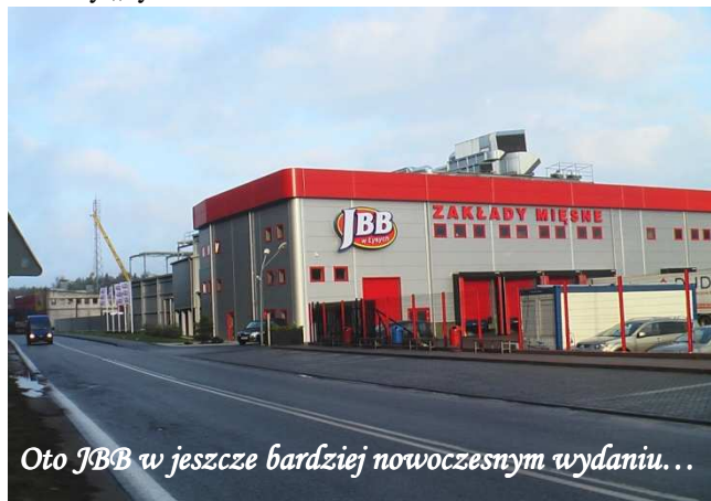
Oto JBB w jeszcze bardziej nowoczesnym wydaniu...