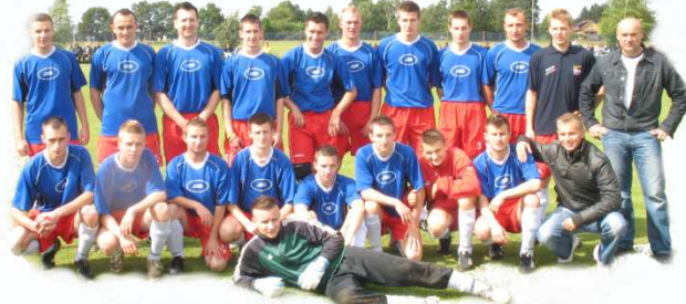
KS Tęcza w komplecie przed meczem na zakończenie sezonu 2008/2009

Pomimo wszystkich przeciwności losu nasza drużyna chce powalczyć w Lidze Okręgowej a my wszyscy trzymamy za nią kciuki. Sympatyków piłki nożnej zapraszamy na rozgrywane na coraz wyższym poziomie mecze. Informacje na temat terminów spotkań są dostępne między innymi na nowej oficjalnej stronie klubu: www.ksteczka.info